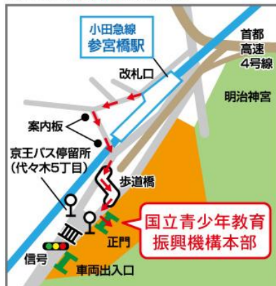
参宮橋からの[横断歩道]を使った経路